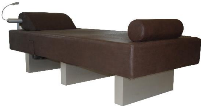
Oriva mit Kopfteil Chromo und Tropfenkissen sowie passender Fussrolle